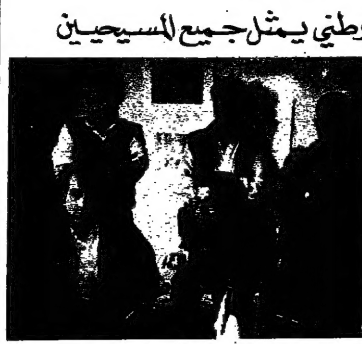
بقرادوني خلال ندوة صحفية (١٠ - رايو)